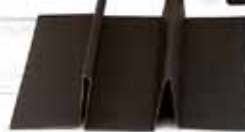
Séparateurs en carton