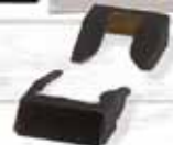
Séparateurs en carton

Nos coffrets peuvent contenir différents types d'équipement pour donner à votre produit une meilleure présentation et sécurité.